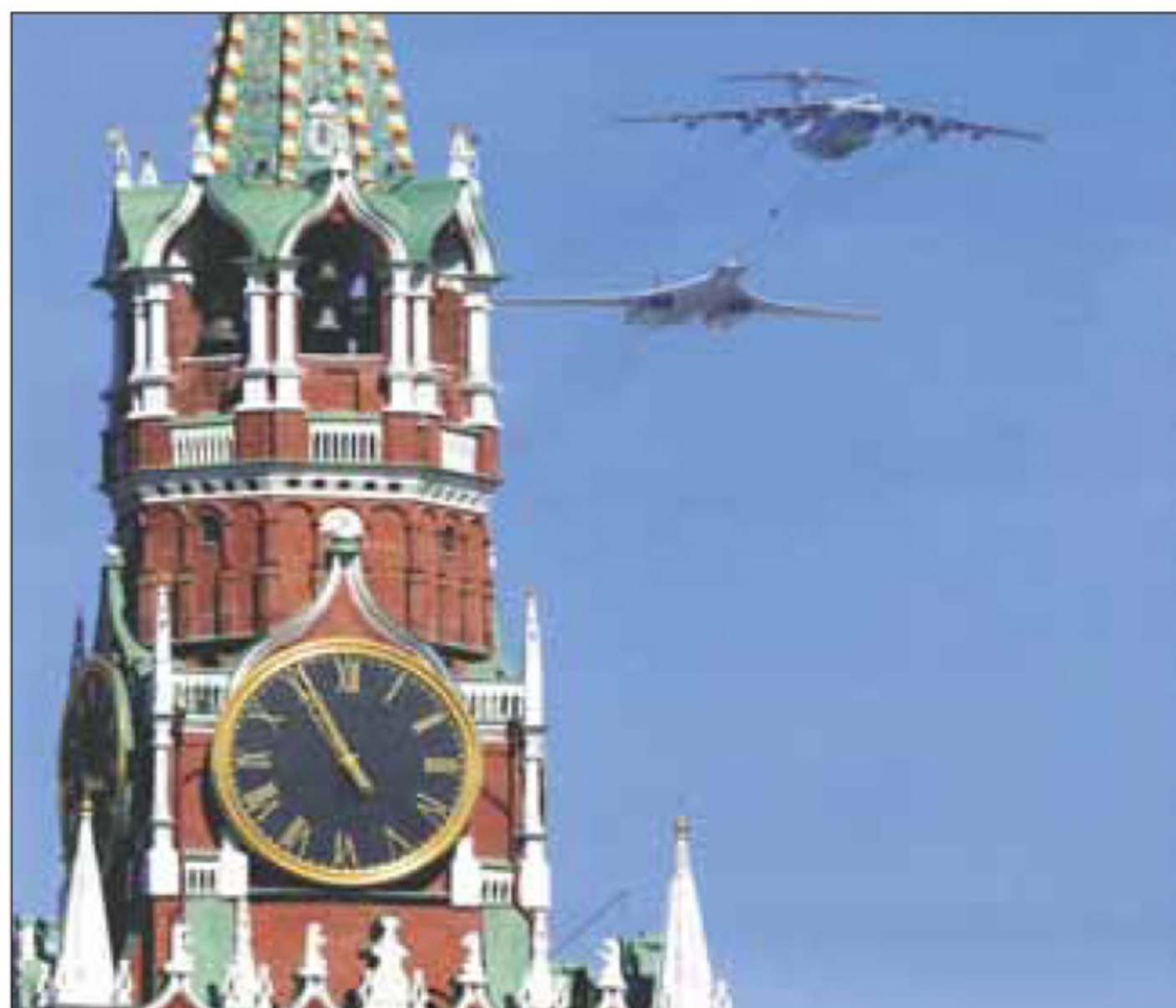
Парад Победы. Имитация заправки Ту-160. Москва, 2013