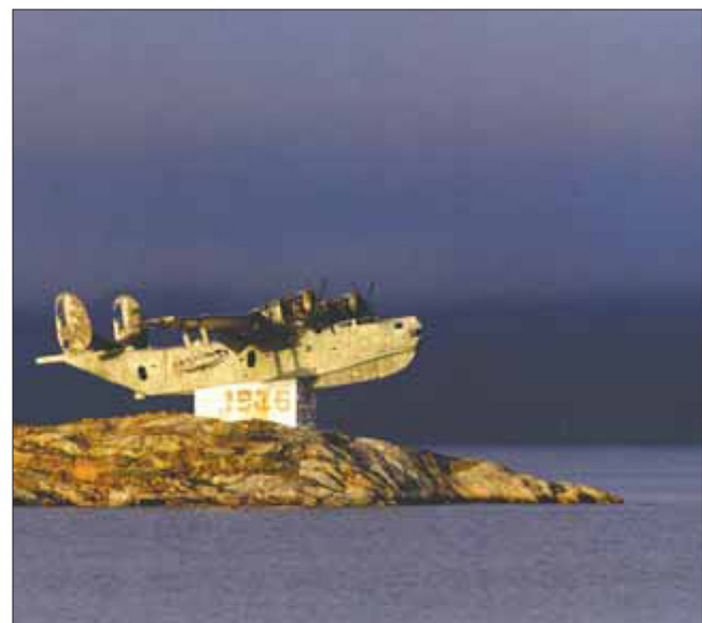
Памятник летающей лодке Бе-6. Гидроаэродром Сафоново, 2013