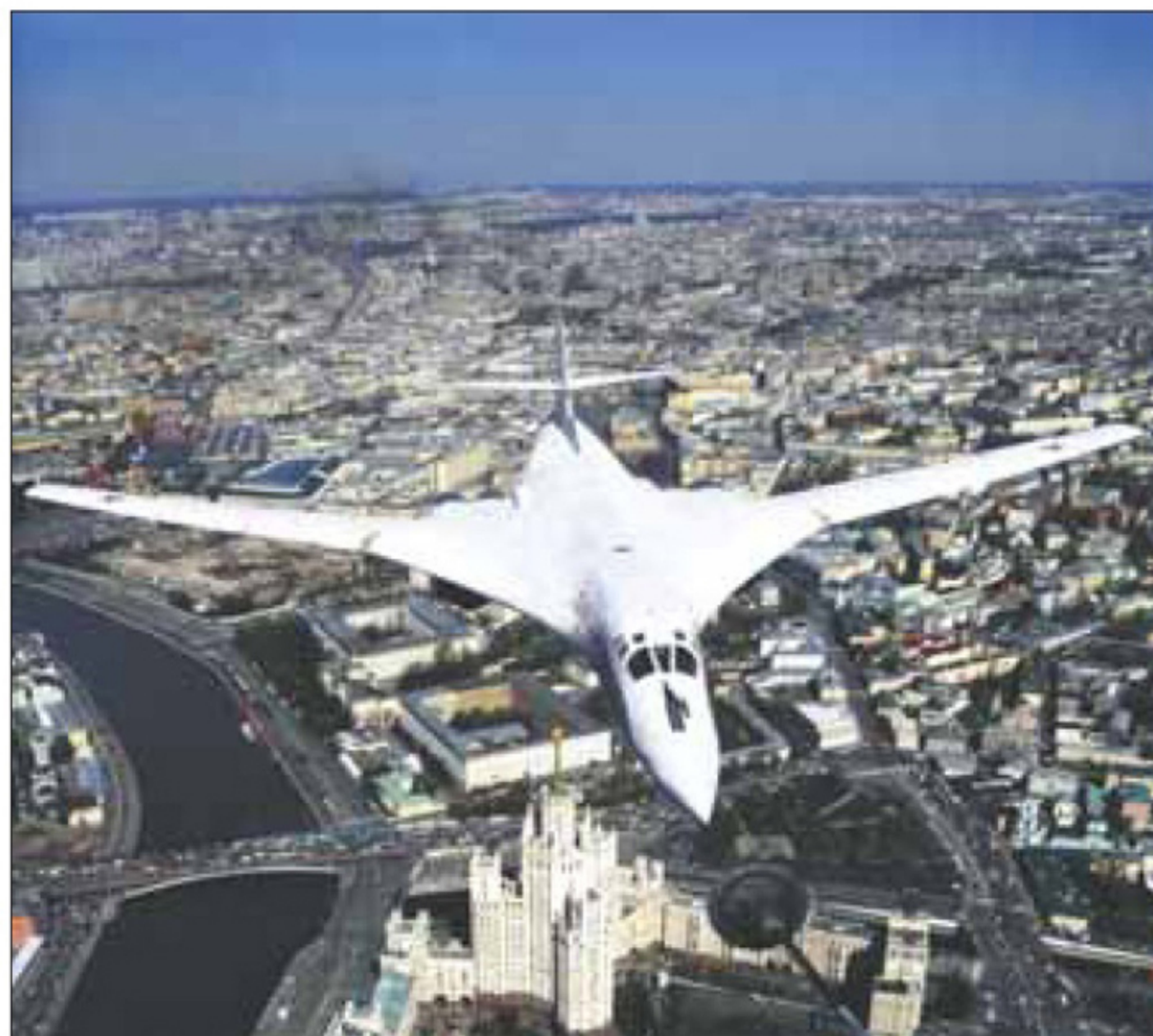
Парад Победы. Имитация заправки Ту-160. Москва, 2013