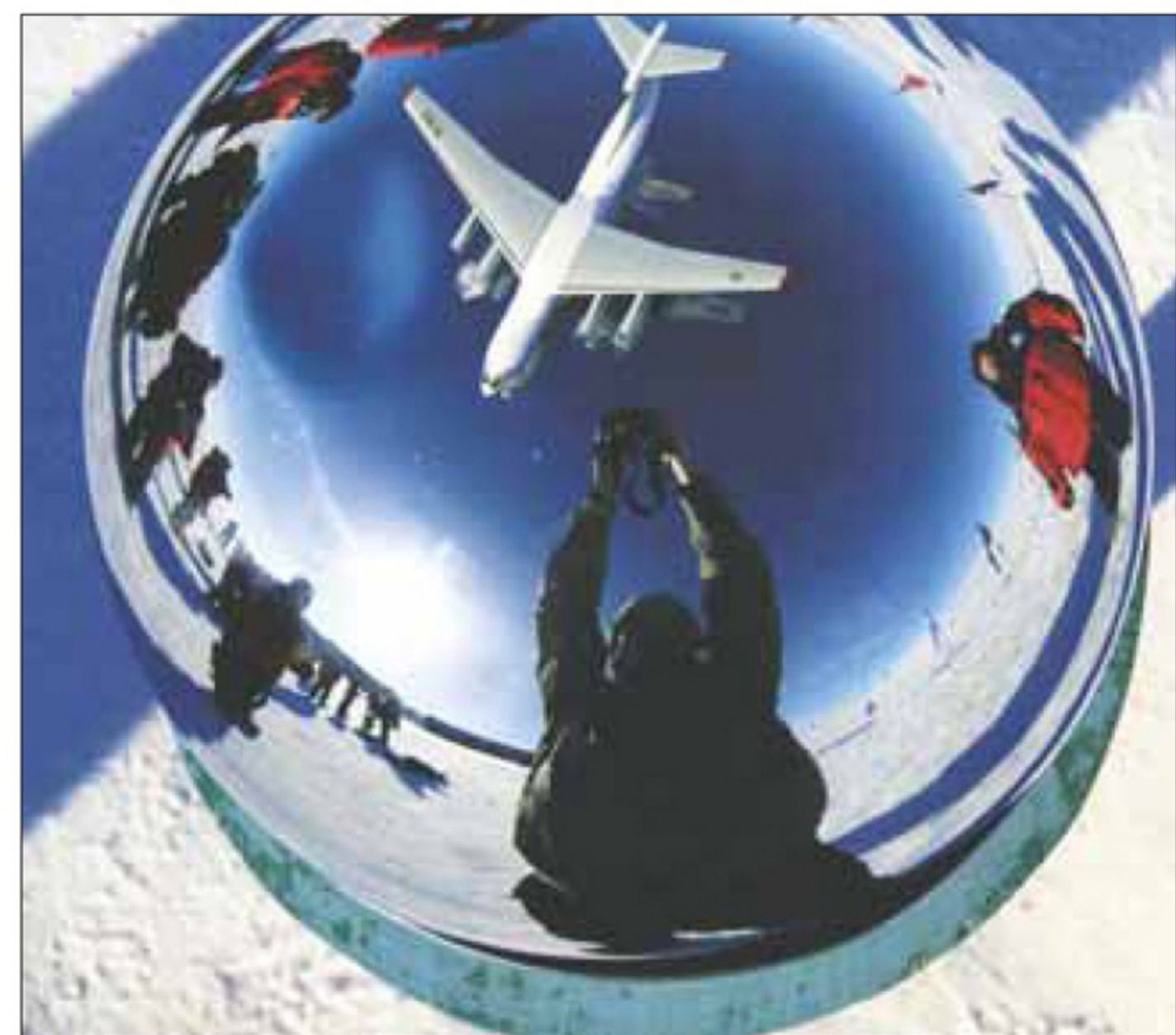
Автопортрет с моделью Ил-76. Южный полюс, 2013