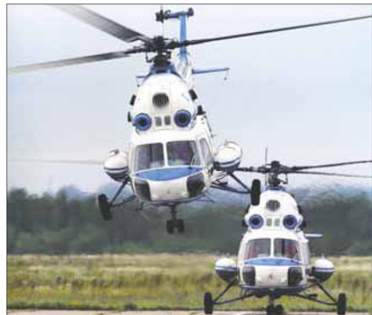
Взлет Ми-2. Сызрань, 2010