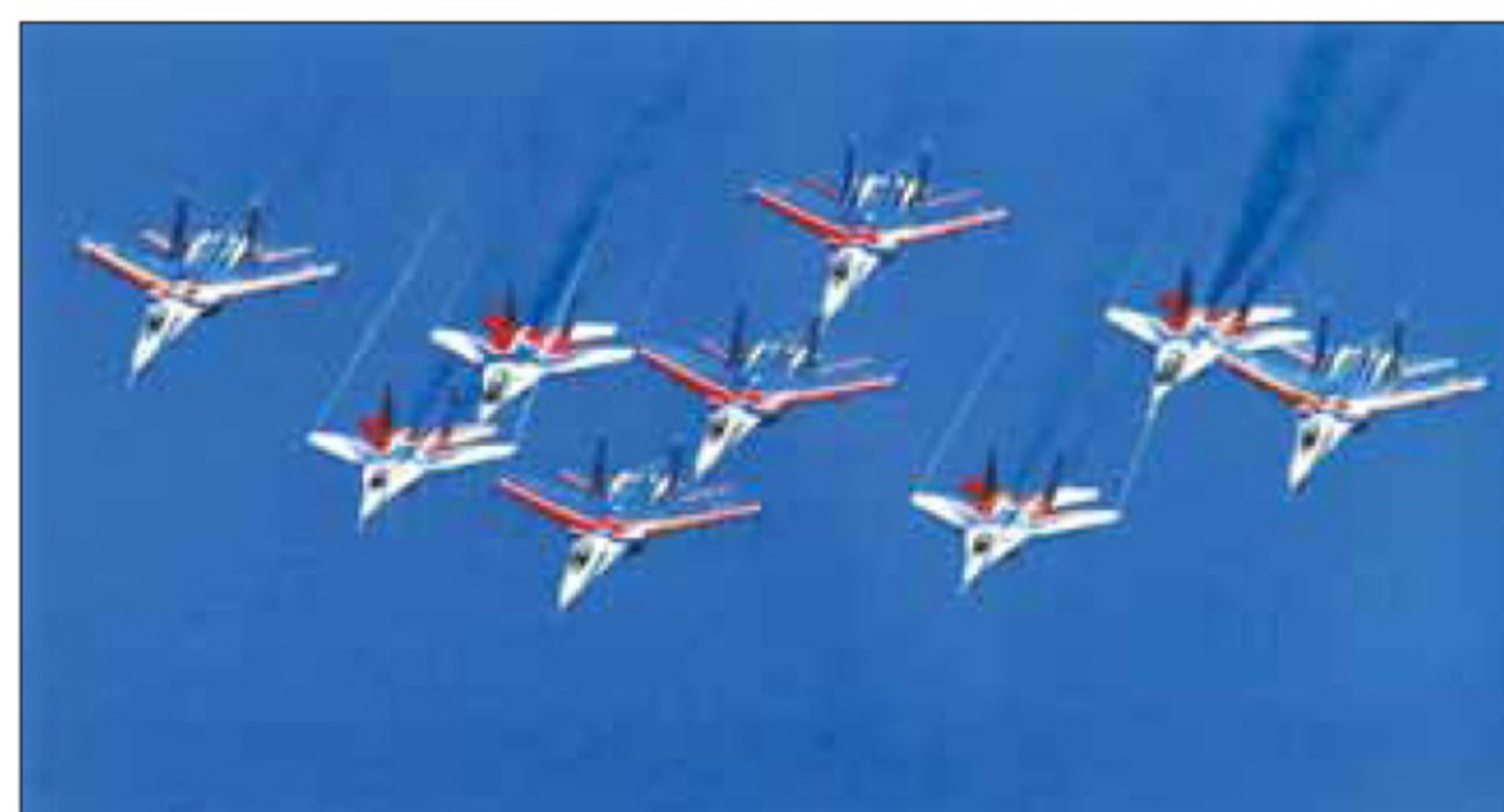
Пилотажная группа «Русские вятичи» на Су-27. Раменское, 2011