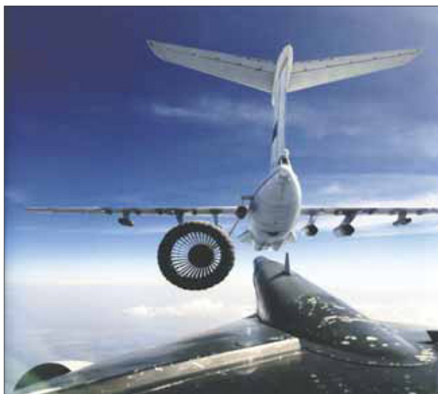
Ил-78М готов отдать топливо. Энгельс, 2012